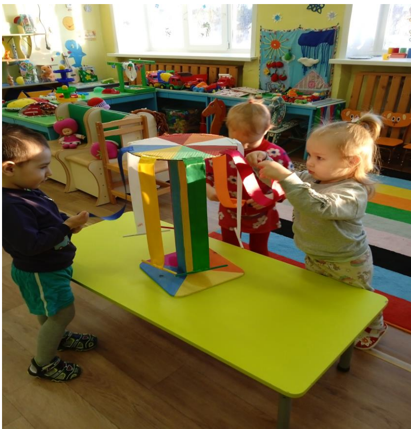
Ди « Разноцветные ленточки »