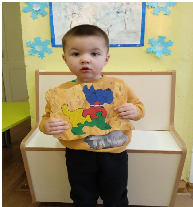
Д/и «Разноцветные пазлы»