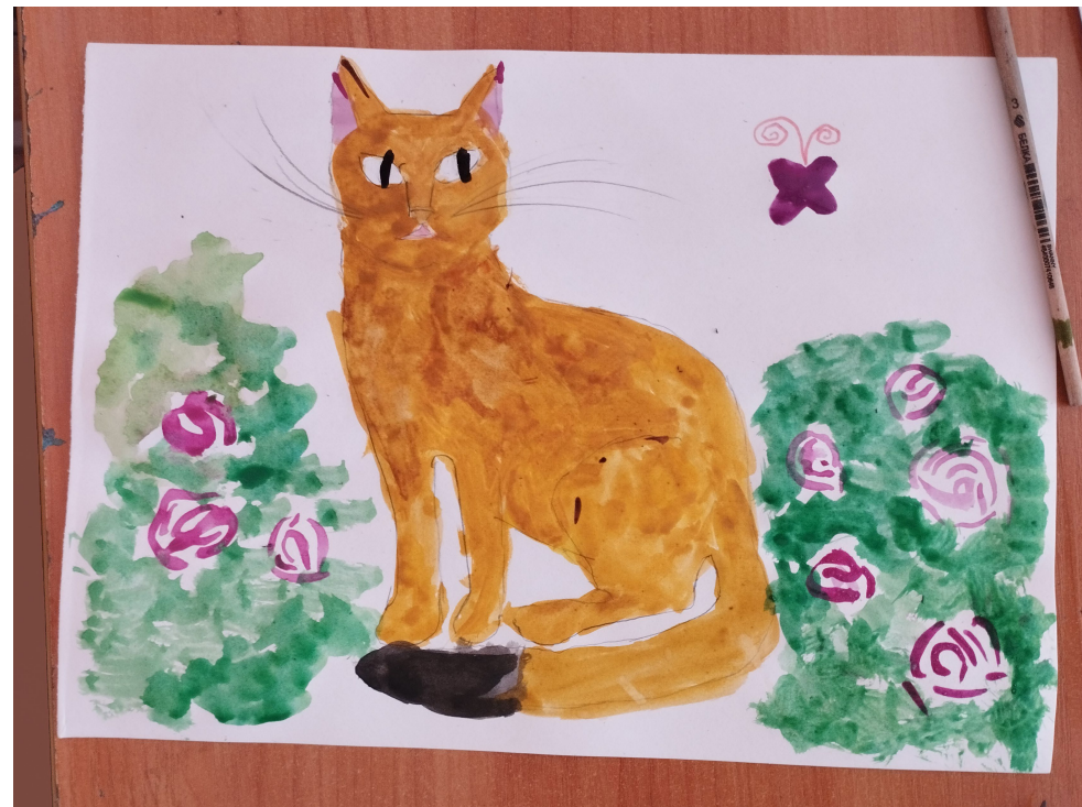
Результаты работы школьников