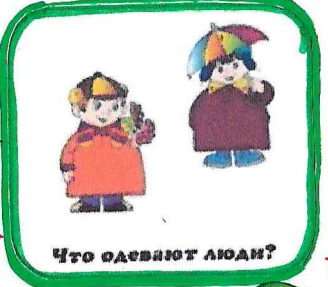
Что одевают люди?