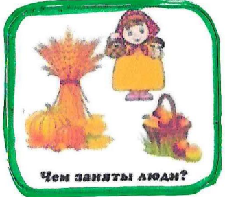
Чем заняты люди?