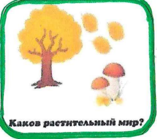
Каков растительный мир?