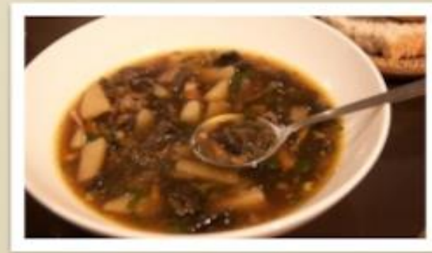
Суп из сушёных грибов