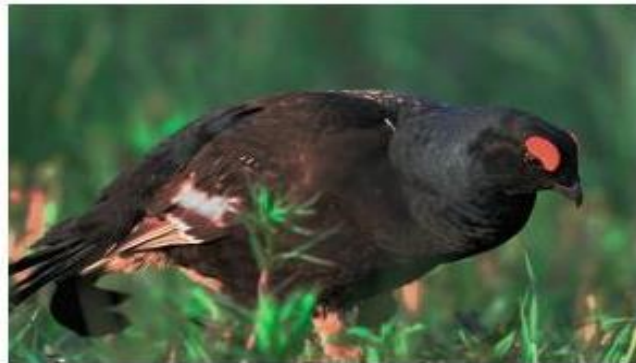
Тетерев - косач