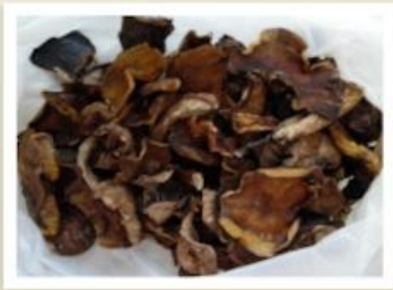
Суп из свежих грибов