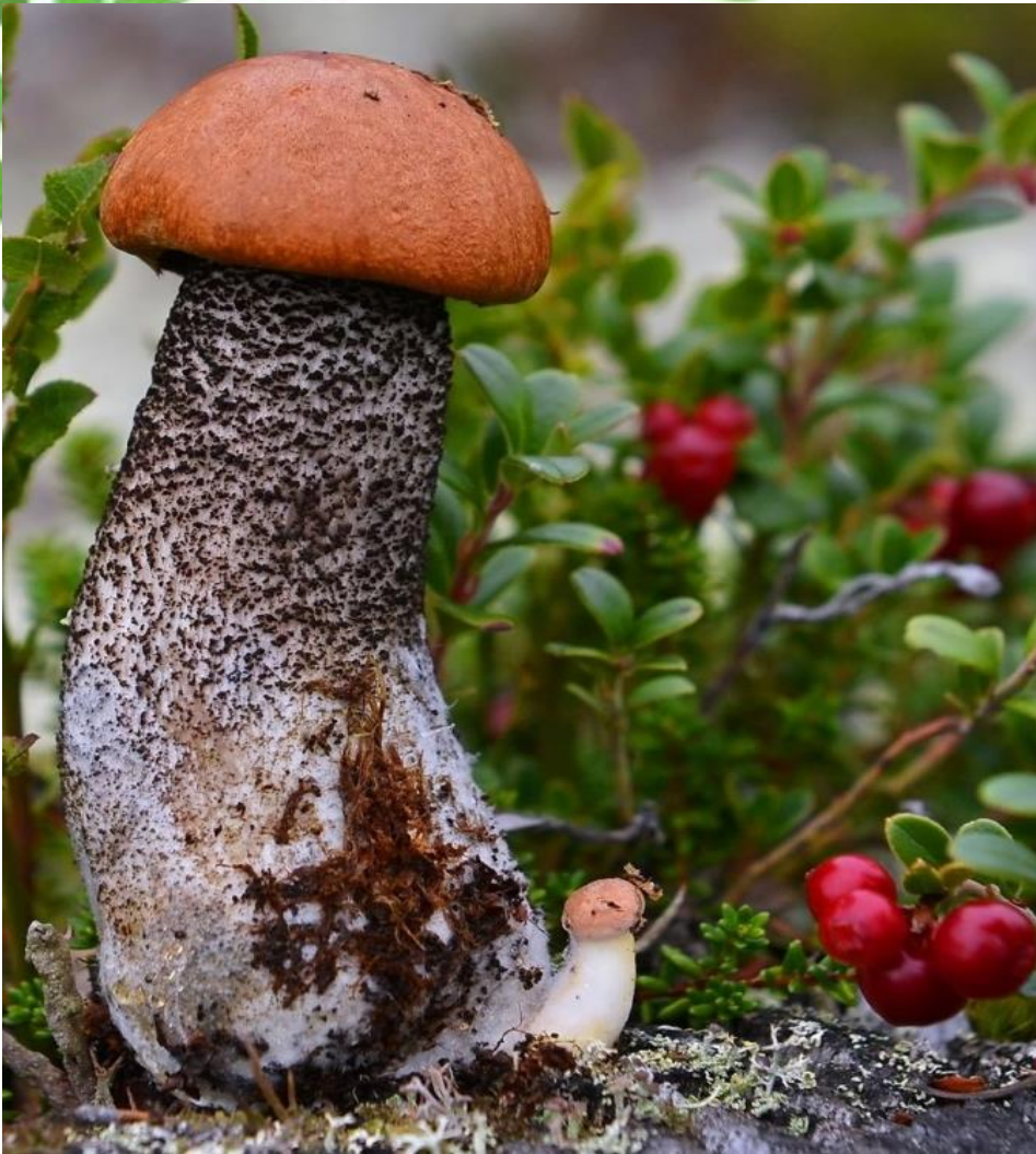
Красноголовики растут под березами