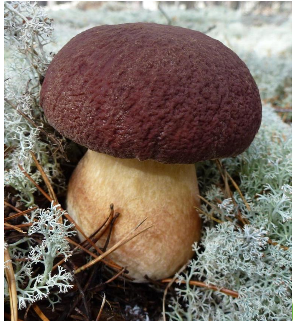
Белый гриб-боровик растет в борах на белом мху- ягеле.