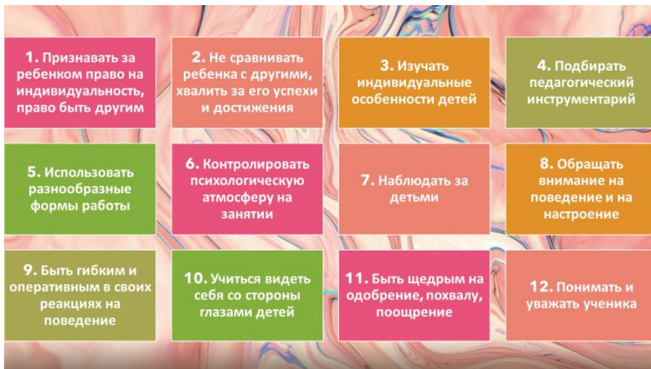
Рис. 2 – Правила, необходимые в реализации индивидуального подхода в работе с кадетами.

Занимаясь с кадетами я придерживаюсь чётких правил (см. рисунок 2)